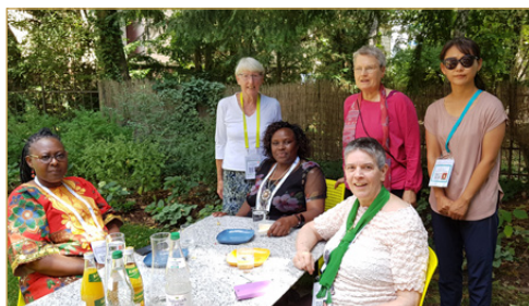
Pfarrerinnen aus 6 Nationen