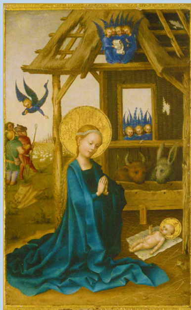
Foto: Stefan Lochner, Anbetung des Kindes

In die freien Felder kannst Du eintragen, an welche Stelle der Bildausschnitt gehört (von oben nach unten). In die Lösungsleiste trägst Du dann die entsprechenden Buchstaben ein.