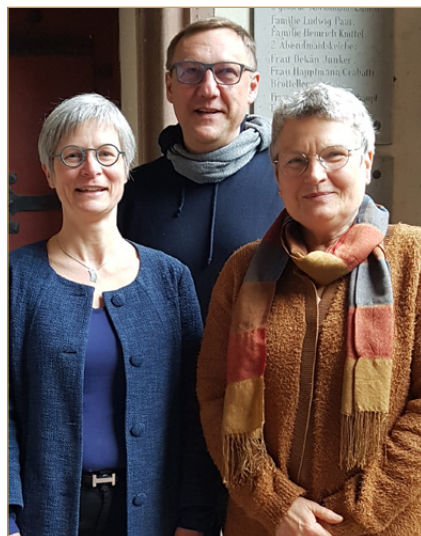
Der neue Vorstand des Fördervereins