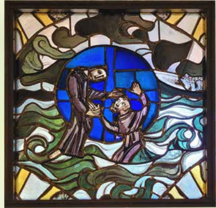
Sinkender Petrus in der Christuskirche

Begriffe: ANGST – BOOT – GLAUBE – HAND – JESUS – LIEBE – MUTIG – PETRUS – RETTUNG – SEE – SINKEN – STURM – WASSER