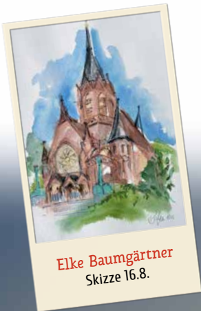
Elke Baumgärtner Skizze 16.8.