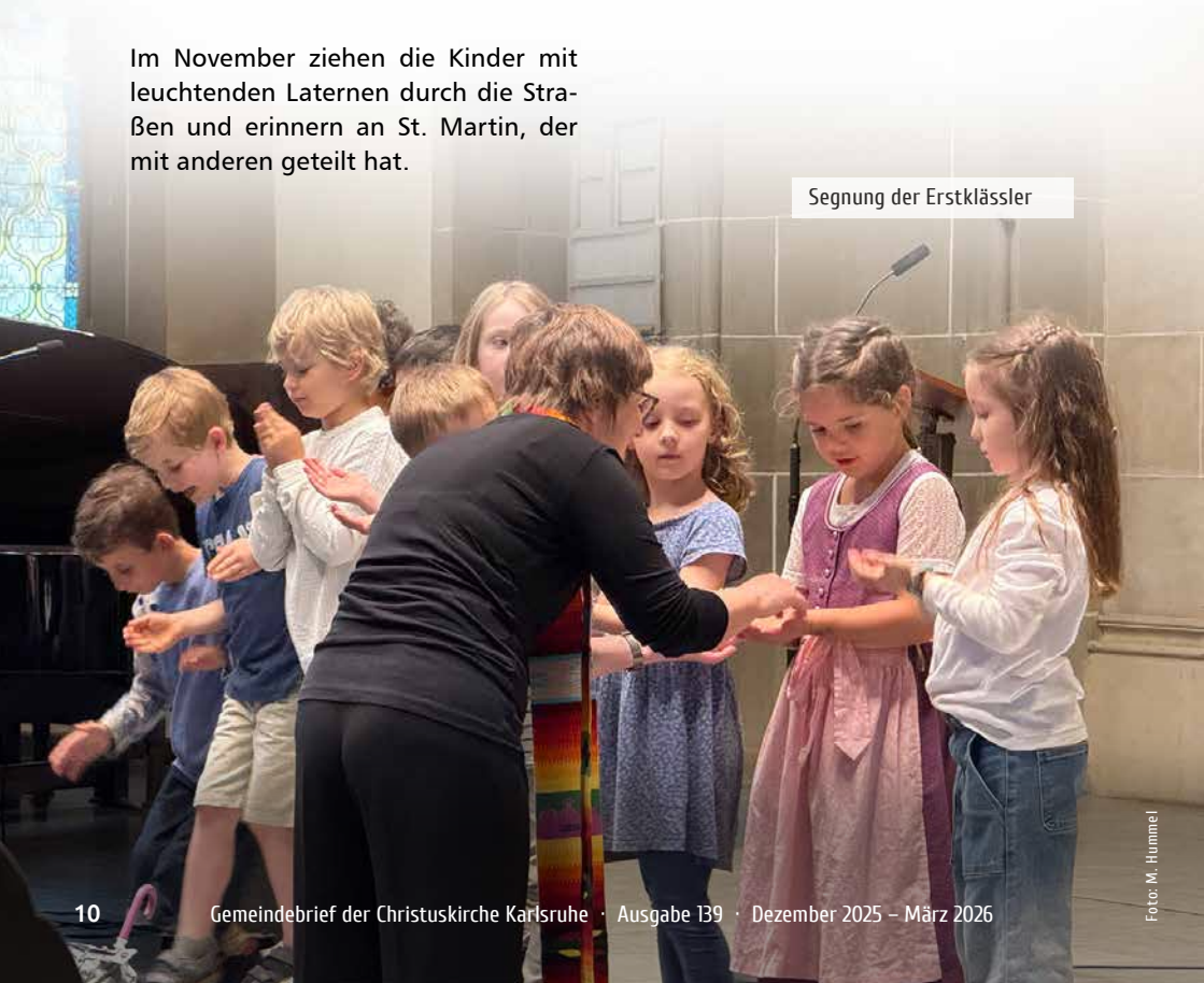
Segnung der Erstklässler