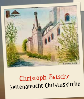
Christoph Betsche Seitenansicht Christuskirche