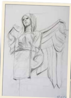
Klaus Bade Engel