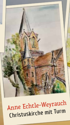
Anne Echte-Weyrauch Christuskirche mit Turm